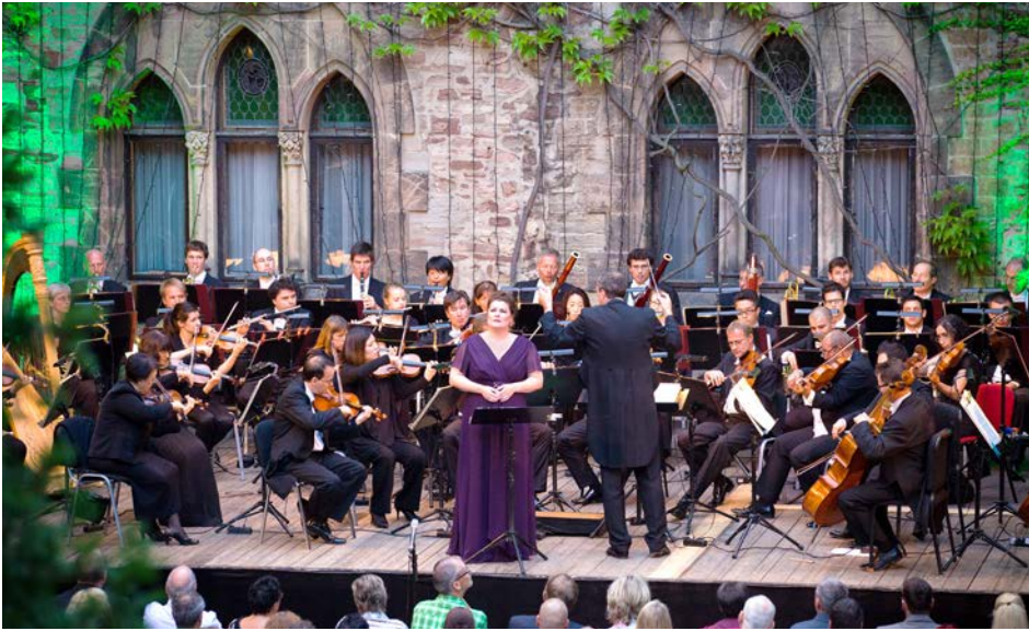
PHILHARMONISCHES KAMMERORCHESTER WERNIGERODE